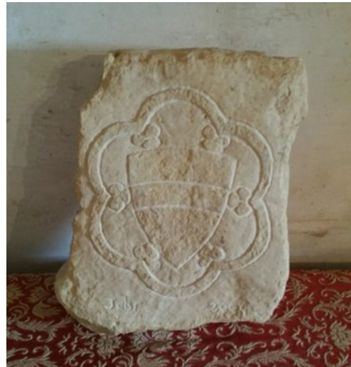
Escudo - Castell de El Papiol

Adela: El Castillo tiene un archivo, aunque está incompleto, faltan lligals molt importants. Las partes más impor-