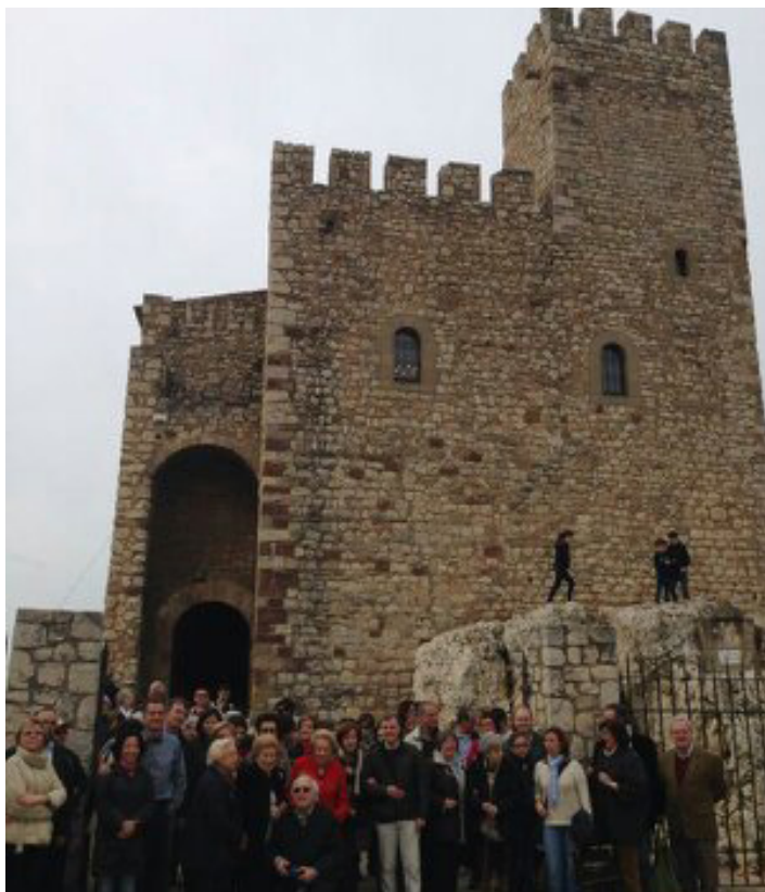
Visita al Castell de El Papiol de la Delegación de Barcelona de la Asociación Española de Amigos de los Castillos en marzo de 2014