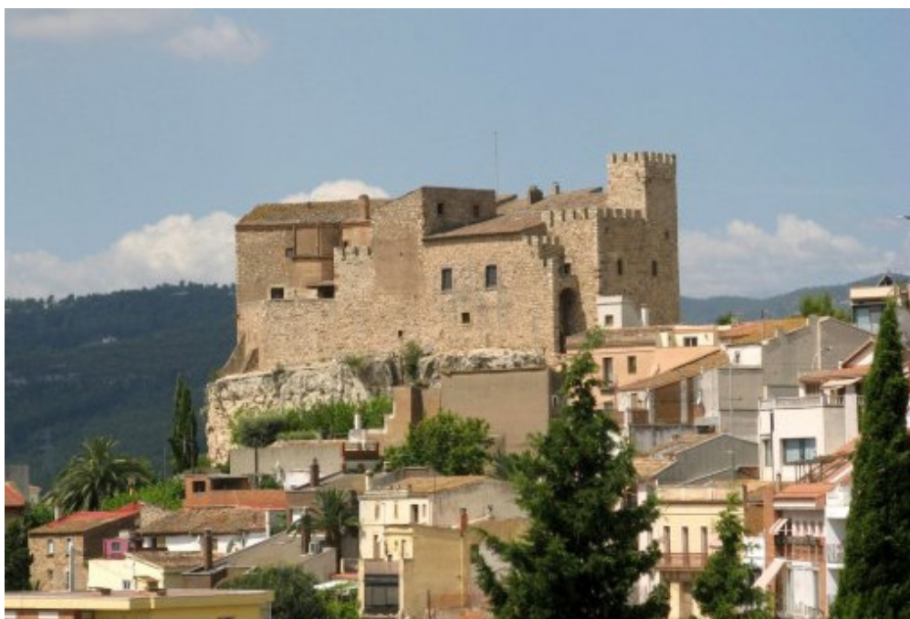
Población de El Papiol con el Castillo roquero (Baix Llobregat)